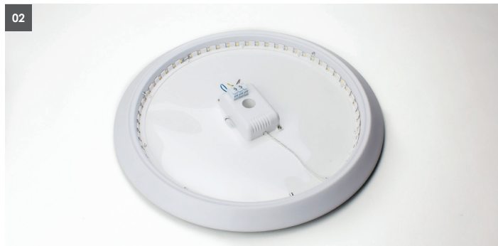
02. Stahlblech-Unterteil in die gewünschte Montageposition bringen und Lochabstand / Schraubenposition auf die Wand / Decke übertragen. 02. Put the steel plate base in desired position for installation and mark the center hole distance / screw position on the wall / ceiling