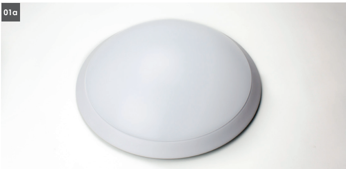
01. Acrylwanne abnehmen. (Acrylwanne gegen den Uhrzeigersinn drehen) 01. Remove acrylic cover (twist anti-clockwise)