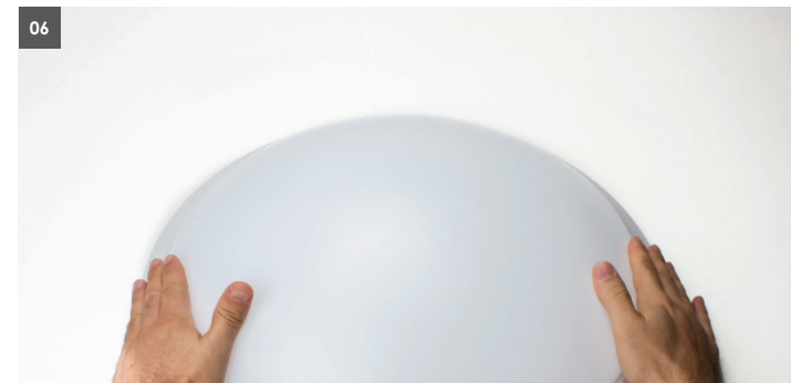
06. Acrylglaswanne auf das Stahlunterteil aufsetzen und durch Drehen im Uhrzeigersinn sichern. 06. Put the acrylic cover on the steel plate base. Twist the diffuser clockwise to attach.