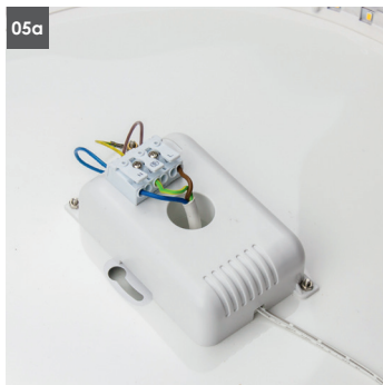
05. Netzkabel an Anschlussklemme anschließen. 05. Connect the power cable with the connecting terminal