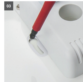
03. evtl. Montagelöcher bohren / Dübel anbringen. 03. If required drill mounting holes / place wall plugs