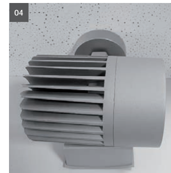
04. Reflektorgehäuse und Deckenrosette wieder montieren. 04. assemble ceiling rosette and reflector body