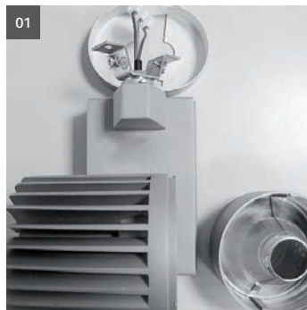
01. Deckenrosette u. Reflektorgehäuse demontieren und Kühlkörper 90° zum Vorschaltgerätgehäuse drehen. 01. disassemble ceiling rosette and reflector body, turn heat sink 90° to body of electronic ballast