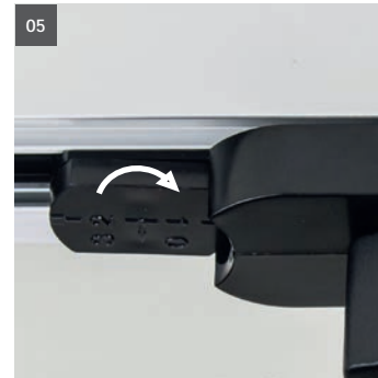
05. Phase 1/2: drehen 05. Phase 1/2: twist