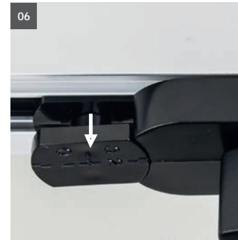
05. Phase 3/0: hochziehen und drehen. 05. Phase 3/0: lift and twist.