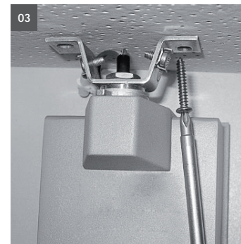
03. Strahler montieren 03. fix the spotlight at the ceiling