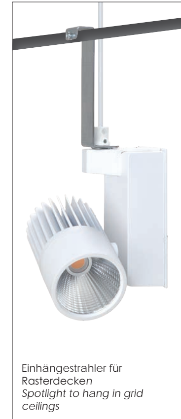
Einhängestrahler für Rasterdecken Spotlight to hang in grid ceilings