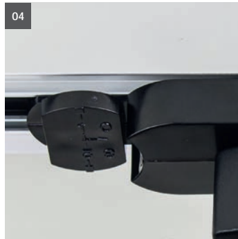
04. Phasenwahrad 04. Phase selector