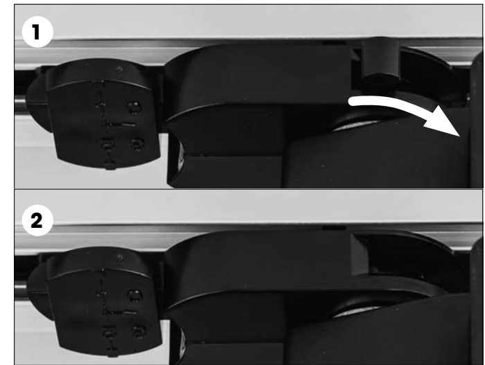
Einsetzen und Verriegeln des 3-Phasen-Universaladapter

Achten sie auf die Führungsnase am Adapter vor dem einsetzen.