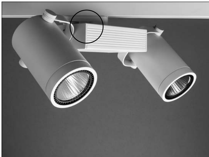
MONTAGE: Leuchte in der Stromschiene einsetzen.