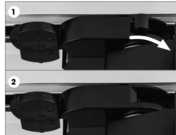
Einsetzen und Verriegeln des 3-Phasen-Universaladapter

Achten sie auf die Führungsnase am Adapter vor dem einsetzen.