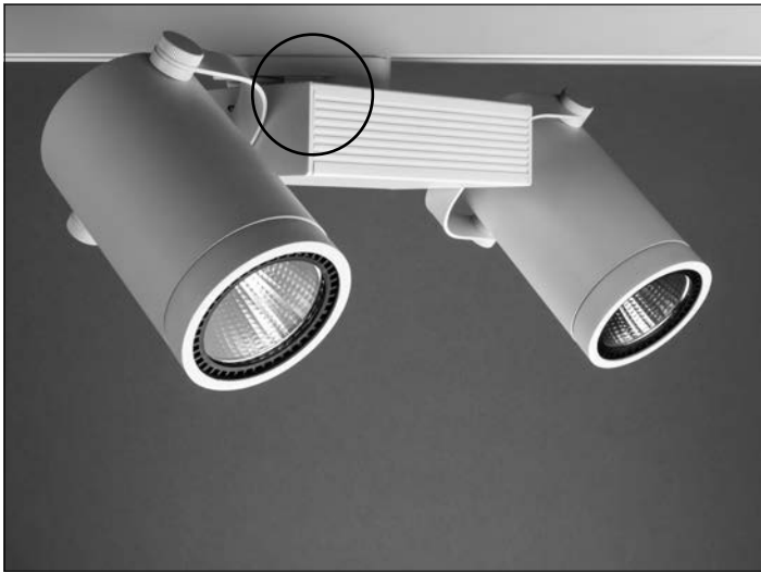
MONTAGE: Leuchte in der Stromschiene einsetzen.