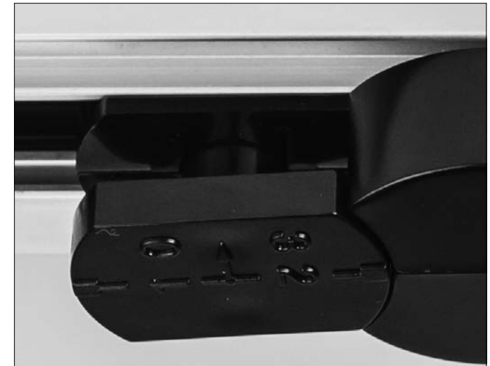
Phase 3/0 runterziehen und drehen