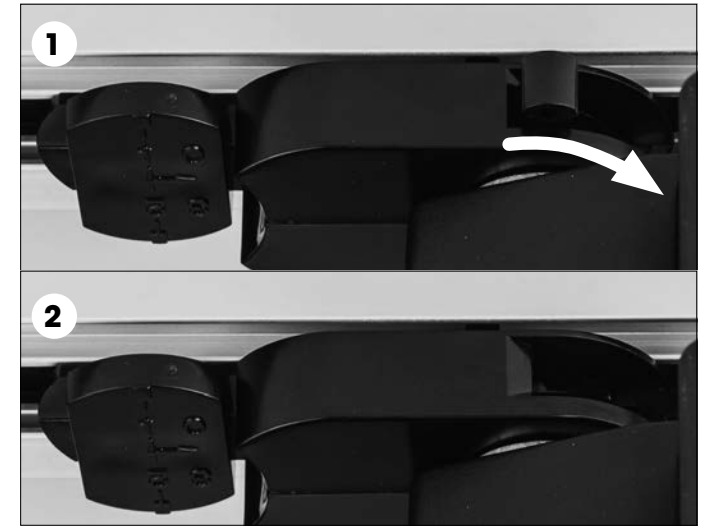
Einsetzen und Verriegeln des 3-Phasen-Universaladapter

Achten sie auf die Führungsnase am Adapter vor dem einsetzen.