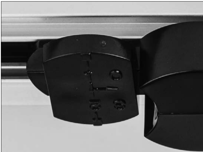
PHASE EINSTELLEN: Phasenwahrdr

Anschließend Kontrolle auf festen Sitz in der Stromschiene.