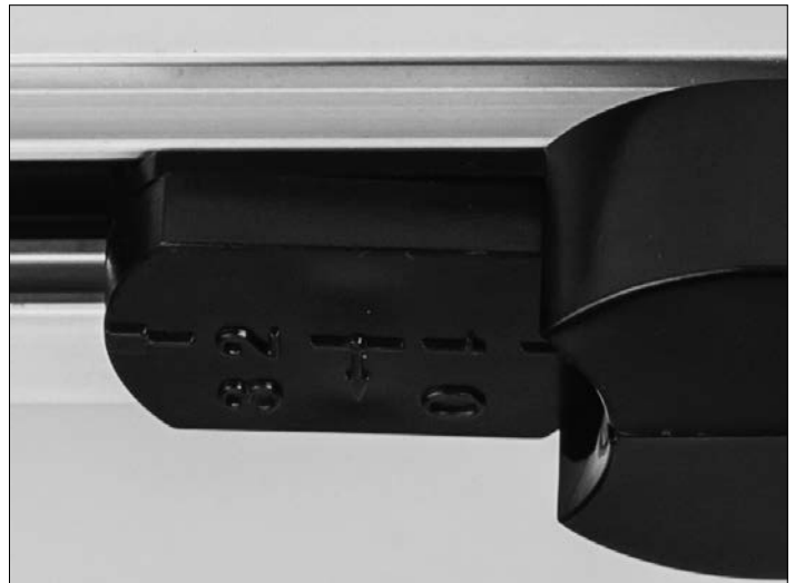
Phase 1/2 drehen